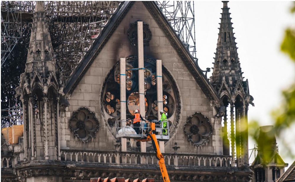
Les p'tits journalistes de la semaine