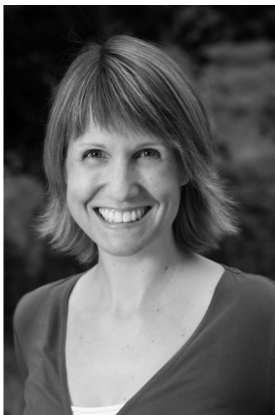
Erin Hunter

Pourquoi en parle-t-on ? Parce qu'un nouveau tome de La Guerre des Clans vient de paraître. Erin Hunter, son auteure, est venue le présenter à Montreuil, au Salon du livre et de la presse jeunesse.