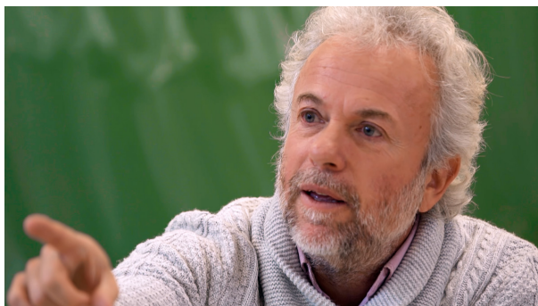
Le philosophe Frédéric

Dans le film, des enfants discutent, argumentent, débattent... comme des grands !