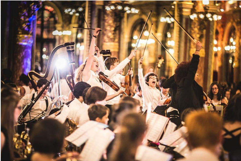
500 enfants musiciens, de 6 à 17 ans, font partie de l'orchestre national des Petites Mains Symphoniques.