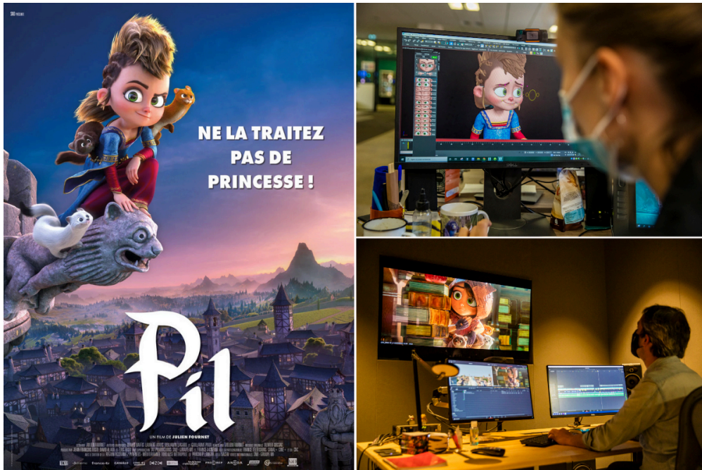
(© Studio TAT – © Vincent Gire/milan presse)

Après Les As de la jungle , voici Pil , la nouvelle création du studio TAT. 1jour1actu a eu la chance de visiter ce grand studio d'animation, basé à Toulouse, et de rencontrer ceux qui ont conçu Pil .