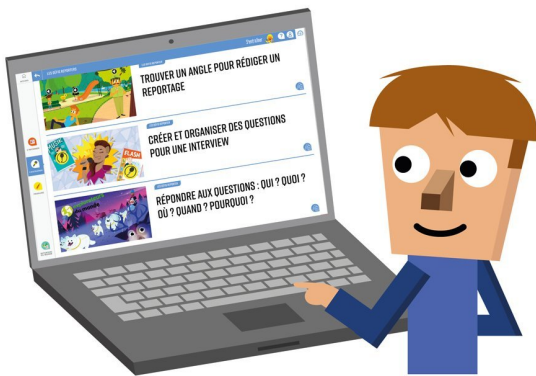
Illustration : Guillaumit.

Quand tu arriveras sur la page d'accueil de la plateforme, tu auras accès à trois espaces différents :