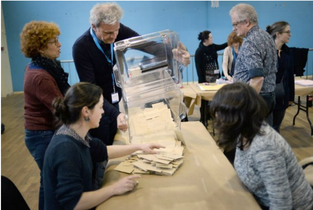
Après le second tour des élections départementales, le dépouillement des bulletins commence dans un bureau de vote à Saint-Nazaire.

Après le second tour des élections départementales, dimanche 29 mars, la droite a remporté la plupart des départements. 1jour1actu te présente le bilan de ces élections.