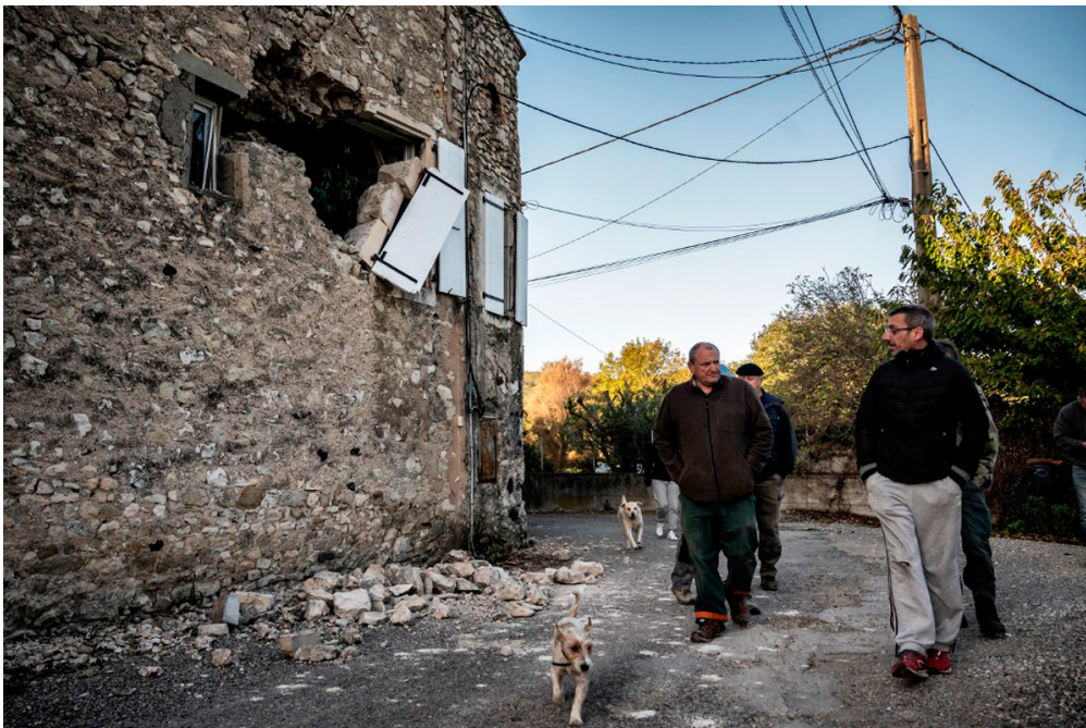
Ces habitants de la ville du Teil, en Ardèche, observent leurs maisons abîmées par le tremblement de terre.

Lundi, les habitants de la région de Montélimar ont senti la terre trembler fort sous leurs pieds. Ce séisme a fait plusieurs blessés, et abîmé de nombreux bâtiments. La France est-elle souvent touchée par des tremblements de terre ? Et que fait-on lorsque cela arrive ? 1jour1actu t'explique tout.