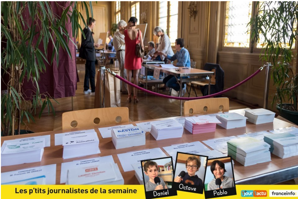
Les p'tits journalistes de la semaine

Dimanche soir, on connaîtra les 577 noms des députés qui vont occuper l'Assemblée nationale pendant 5 ans. Le résultat est très attendu car il est possible qu'une très grande majorité de députés appartienne au nouveau parti du président de la République.