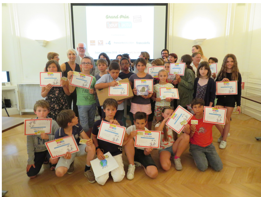
La classe des CM2 de l'école Notre-Dame-de-Piétat, de Condom, réunie pour la remise du Trophée du Grand Prix 1jour1actu 2018