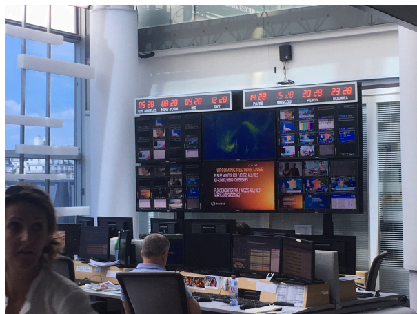
Le plateau d'enregistrement de la chaîne France TV Info

Merci aux partenaires du Grand Prix 1jour1actu :