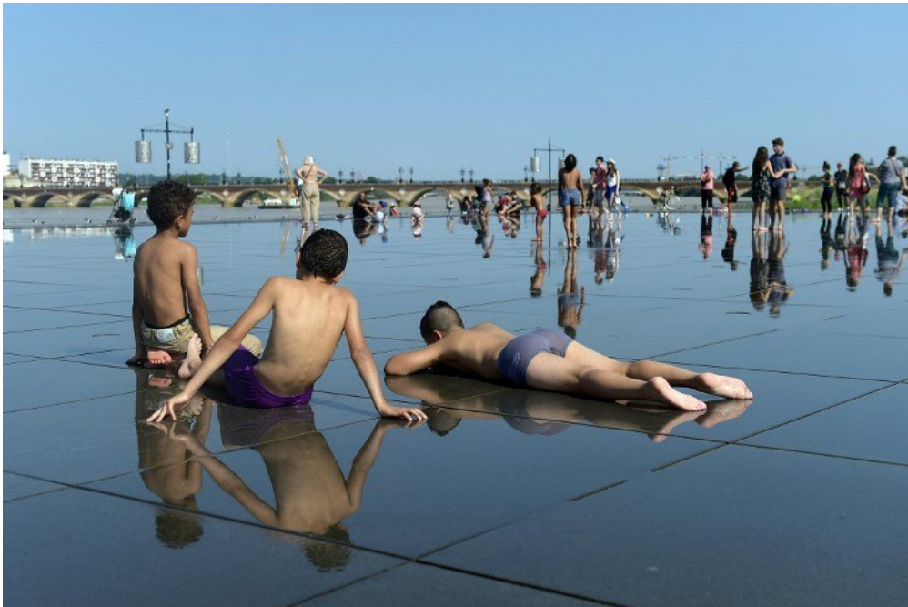
Ouf, un peu de fraîcheur grâce au plus grand miroir d'eau au monde du centre-ville de Bordeaux.