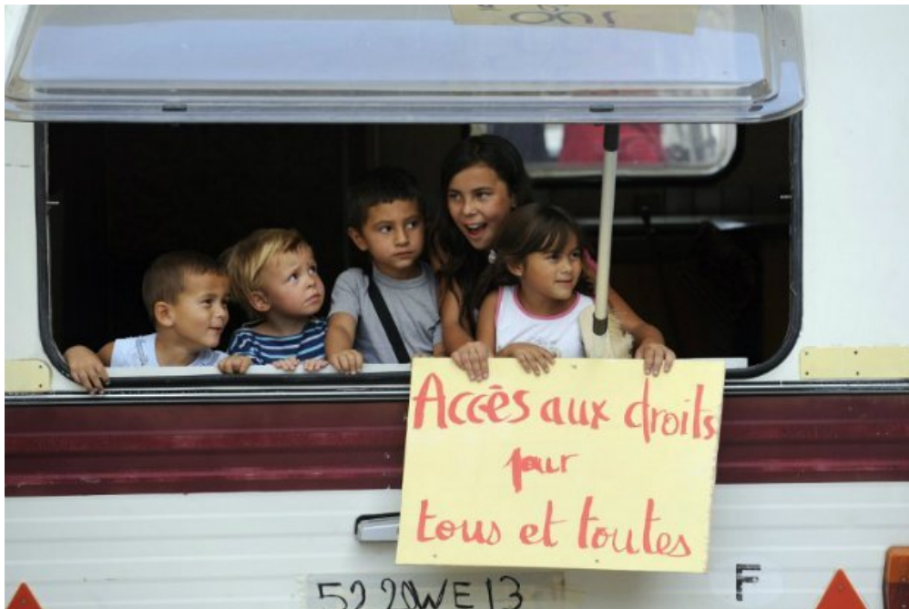
Dans le département des Bouches-du-Rhône (Marseille), des enfants Roms manifestent depuis la caravane où ils vivent avec leur famille.

Tous les 5 ans, la France passe un examen à l'ONU pour vérifier si les droits des enfants y sont bien respectés. L'UNICEF a publié un rapport le 9 juin : la France n'est pas la première de la classe, elle peut mieux faire !