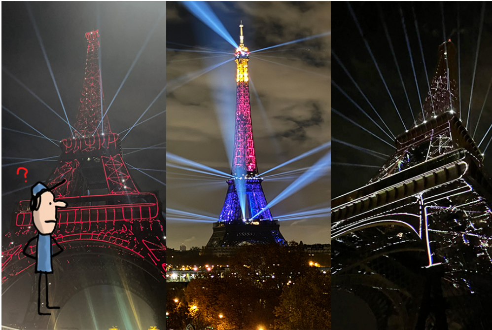
(Illustration : © Jacques Azam)

La semaine dernière, de minuit jusqu'au matin, la tour Eiffel a surpris les habitants avec de jolies lumières colorées. De nombreuses personnes se sont demandé ce qu'il se passait. Voici la réponse?!