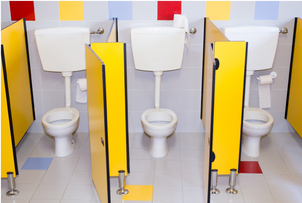
Des toilettes toutes propres à l'école?? Un rêve pour des milliers d'élèves?!

Tu t'es peut-être déjà retrouvé(e), à l'école ou dans un lieu public, devant des toilettes... dégoûtantes. Eh oui, même en France, il n'est pas toujours facile d'accéder à des toilettes propres ! À l'occasion de la Journée mondiale des toilettes, 1jour1actu t'explique pourquoi ce sujet est important pour ta santé.