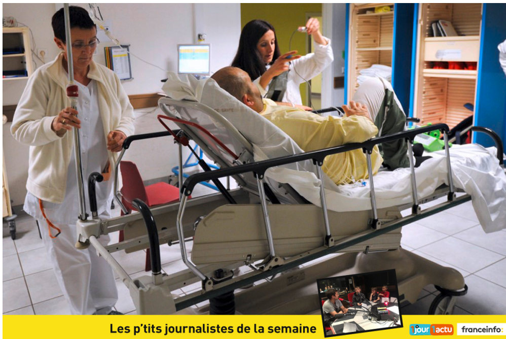
Les p'tits journalistes de la semaine

À la suite d'un accident, ou si l'on est malade en pleine nuit, on peut se rendre aux urgences. Là, des soignants spécialisés peuvent intervenir. Aujourd'hui, en France, ils sont nombreux à dénoncer leurs conditions de travail difficiles. Quelles sont les particularités de ces métiers ? Un médecin urgentiste a répondu aux questions des p'tits journalistes de franceinfo junior, l'émission de radio partenaire d'1jour1actu.