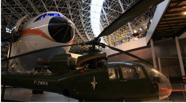
l'aviation. Un ancien avion, l'A300B, derrière un hélicoptère de l'armée

Le musée se trouve dans une immense halle de 7671 m 2 . Avant que la halle ne soit totalement fermée, les avions et hélicoptères ont été tractés à l'intérieur avec des véhicules spéciaux utilisés dans les aéroports. Au total, 25 avions et hélicoptères civils ou militaires sont exposés. Ici, tu peux voir l' A300B , un avion de ligne qui date du début des années 1970 et un hélicoptère militaire . L'A300B pouvait transporter 250 passagers. Il fallait trois personnes pour le piloter : deux pilotes et un mécanicien navigant. Aujourd'hui, avec les différents progrès technologiques, les pilotes n'ont plus besoin du mécanicien dans le cockpit.