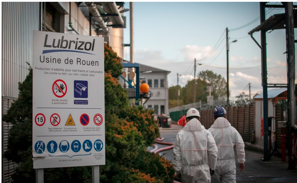
Les p'tits journalistes de la semaine

La semaine dernière, l'usine Lubrizol de Rouen a été en partie détruite par un incendie. Les habitants de la région ont peur d'avoir respiré de l'air pollué. Que s'est-il passé exactement ? Ont-ils raison de s'inquiéter ? Pour en savoir plus, les p'tits journalistes de franceinfo junior, l'émission partenaire d'1jour1actu, ont interrogé une spécialiste.