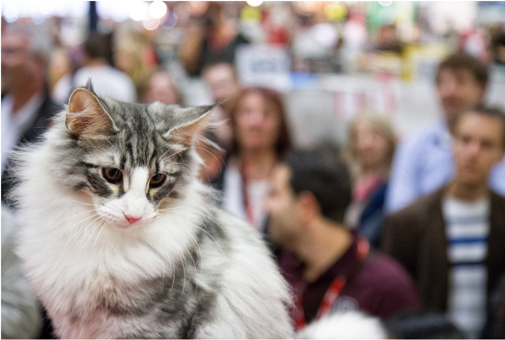
(© Animal Expo)

Plus égoïste, plus indépendant et moins reconnaissant que le toutou ? Le chat a pourtant détrôné le chien dans le cœur des Français ! La preuve en chiffres.