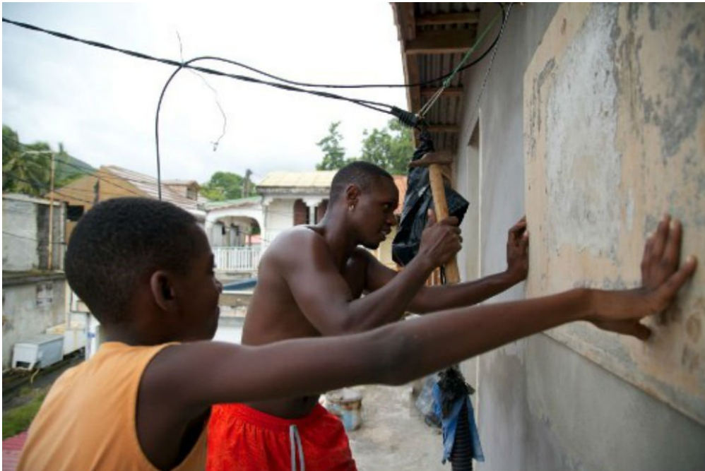
Avant l'arrivée de l'ouragan Maria, les Guadeloupéens ont protégé leurs habitations, en clouant de grands panneaux en bois devant les portes et fenêtres.

La Guadeloupe a été balayée par l'ouragan Maria dans la nuit de lundi à mardi (lundi, aux Antilles*). Après son passage, on compte deux morts et deux personnes sont portées disparues. L'autre île française, la Martinique, a été relativement épargnée. Actuellement, Maria a quitté la Guadeloupe et se dirige vers l'ouest en direction de Porto Rico.