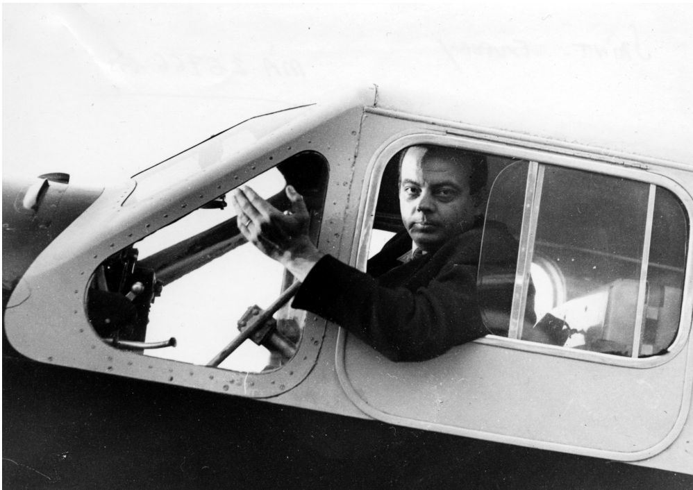
Antoine de Saint-Exupéry a 35 ans : c'était déjà un pilote expérimenté, prêt à prendre tous les risques pour acheminer le courrier par-delà les mers et les montagnes.

Il y a 120 ans, naissait Antoine de Saint-Exupéry. Connu pour être l'auteur du Petit Prince , un des livres les plus célèbres au monde, c'était aussi un pilote exceptionnel... au grand cœur. Deux expositions, à Toulouse et à Lyon, lui rendent hommage.