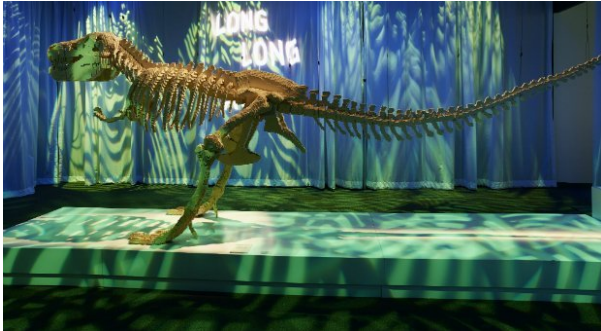
Un T-Rex en Lego

Oui ! Les visages et les corps sont assez difficiles parce qu'ils ont des formes courbes ou rondes alors que les legos, eux, sont rectangulaires ! Mais, avec de la patience, on y arrive. Finalement, avec mon exposition, j'espère montrer aux enfants et aux adultes que tout le monde peut sculpter avec des Lego et qu'il faut laisser parler sa créativité et son imagination.