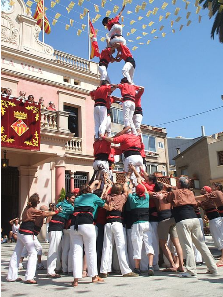
Un castell en Catalogne.