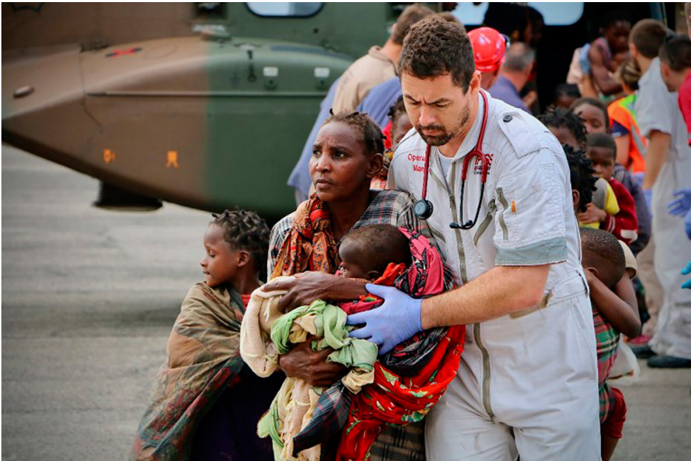
Ce secouriste escorte une famille, secourue au Mozambique, après le passage du cyclone.

Dans la nuit du 14 au 15 mars, un cyclone a frappé plusieurs pays d'Afrique. Le Mozambique est le pays le plus touché, avec de nombreux morts et des villes entièrement détruites. Les secouristes sont désormais au travail pour aider les survivants de cette catastrophe.