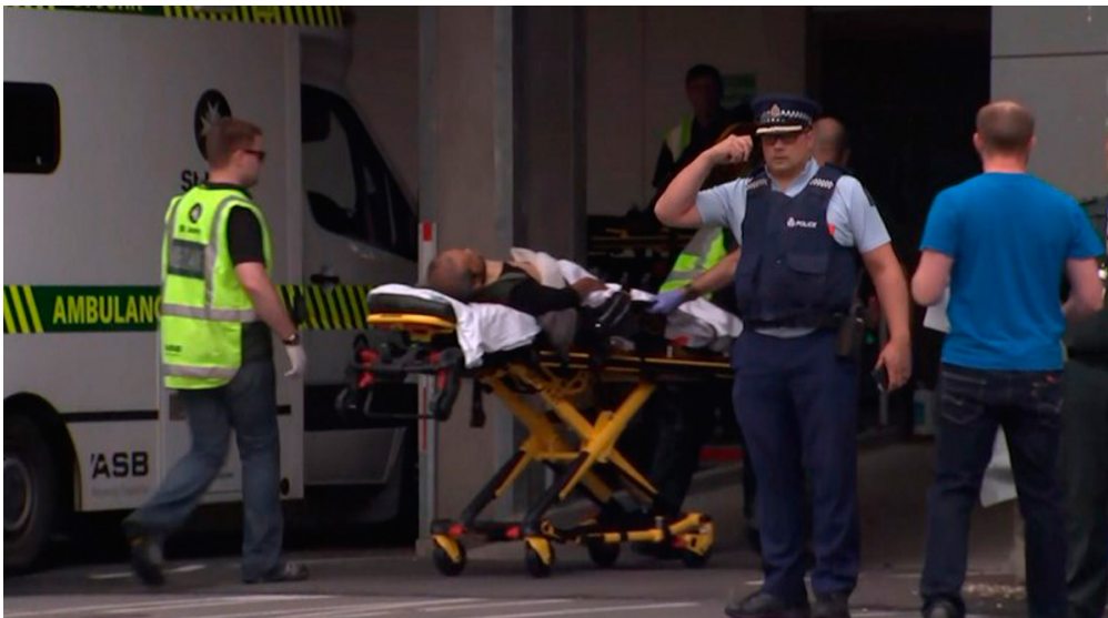
Une personne blessée est amenée à l'hôpital, après l'attentat dans deux mosquées de Christchurch, en Nouvelle-Zélande.

La Nouvelle-Zélande, un pays d'Océanie, vient d'être frappée par une attaque terroriste. Dans deux mosquées de la ville de Christchurch, des musulmans qui étaient en train de prier se sont fait tirer dessus. Cet attentat a fait de très nombreuses victimes. C'est la première fois que ce pays est frappé par le terrorisme.