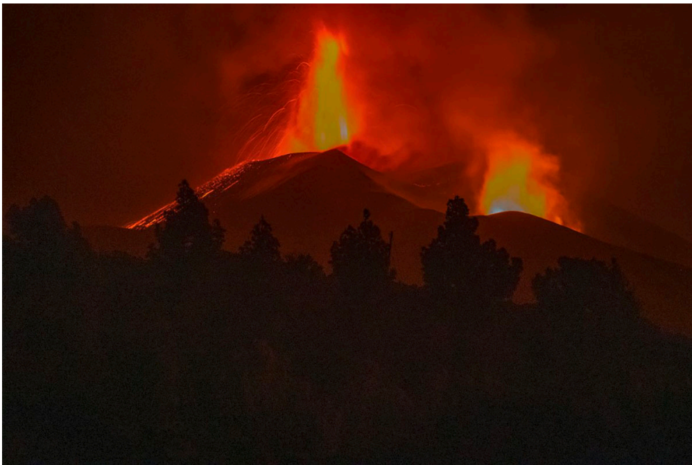
Sur l'île de la Palma

Depuis le 19 septembre, l'île de La Palma, dans l'archipel des Canaries, vit au rythme d'une brutale éruption volcanique. Isabelle est passionnée par ce phénomène naturel. Elle a approché les volcans les plus redoutés de la planète. Mais ce qui se passe aux Canaries dépasse tout ce qu'elle a vu avant. Nous l'avons interviewée à son retour de La Palma.