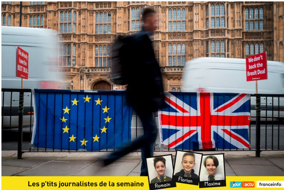
Les p'tits journalistes de la semaine