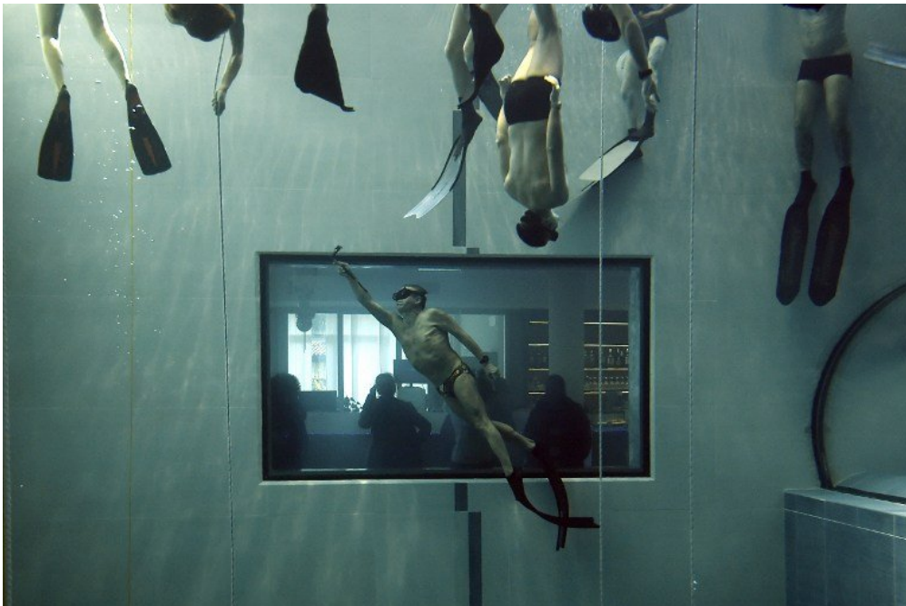
Des plongeurs en apnée pendant un cours du grand apnéiste italien Umberto Pelizzari.

Inaugurée en juin dernier, une piscine italienne de 42 mètres de profondeur connaît un immense succès. Elle a été construite avant tout pour l'entraînement des plongeurs.