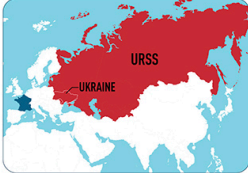
Cette carte date d'il y a plus de 30 ans. À l'époque, l'Ukraine était une partie de l'URSS.

Pendant longtemps, l'Ukraine et la Russie ont fait partie d'un même pays : l'URSS. En 1991, l'Ukraine est devenue indépendante, mais Vladimir Poutine ne l'accepte toujours pas. Pour lui, les Russes et les Ukrainiens ne forment qu'un seul peuple , et l'Ukraine devrait appartenir à la Russie.