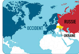
Aujourd'hui, l'Ukraine est indépendante.

L'Ukraine se situe entre deux grands rivaux : la Russie et l'Occident (les pays d'Europe de l'Ouest et d'Amérique du Nord). Depuis son indépendance, l'Ukraine cherche à s'allier avec l'Occident. Mais Vladimir Poutine veut empêcher ce rapprochement en contrôlant l'Ukraine. Au passage, il montre aussi sa puissance aux autres pays du monde.