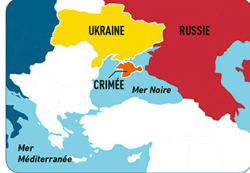
La mer Noire offre un accès aux océans du monde entier.

Ce n'est pas la première fois que la Russie attaque l'Ukraine. Depuis 2014, des troupes russes occupent la Crimée. Cela permet à la Russie d'accéder à une mer qui ne gèle pas en hiver. Cela facilite, toute l'année, les déplacements des navires russes, aussi bien commerciaux que militaires, vers les océans du monde entier.