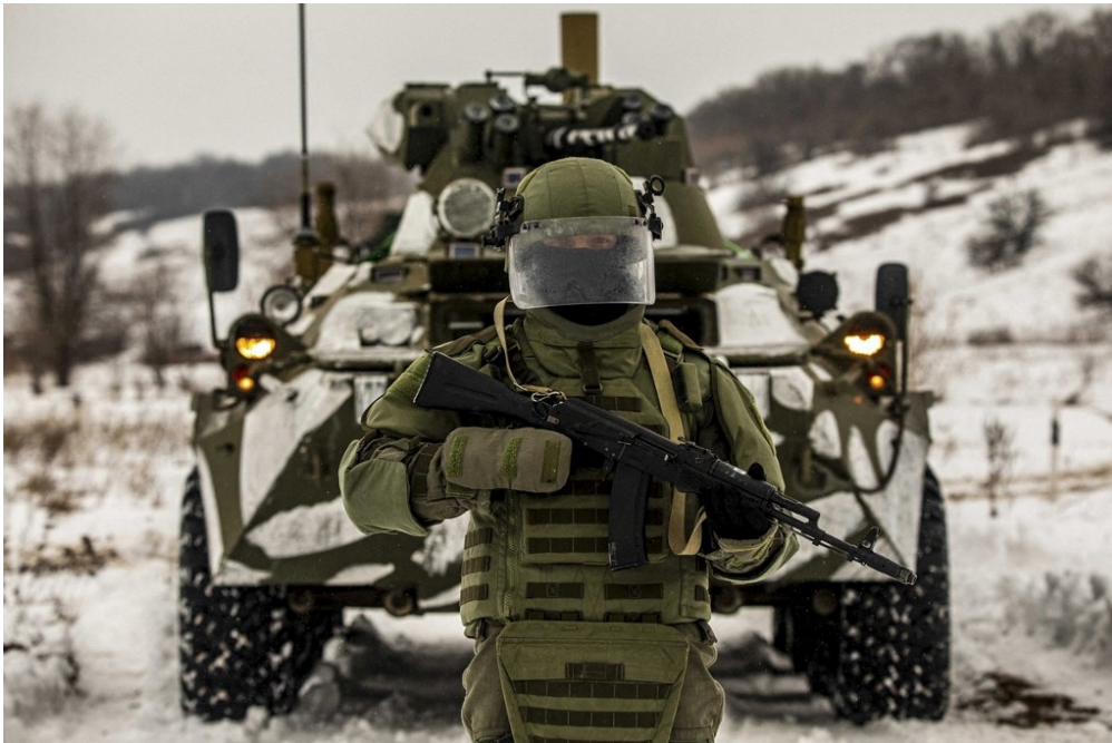
Un militaire russe, photographié le 29 janvier. Au moins 100 000 soldats russes ont été rassemblés à la frontière ukrainienne, ces derniers mois.

En ce moment, on parle beaucoup de l'Ukraine aux infos. C'est parce que ce pays est au cœur de fortes tensions entre deux grandes puissances : la Russie et les États-Unis. Pour mieux comprendre ce qu'il se passe, 1jour1actu a interviewé Anna Colin Lebedev, une spécialiste du sujet.