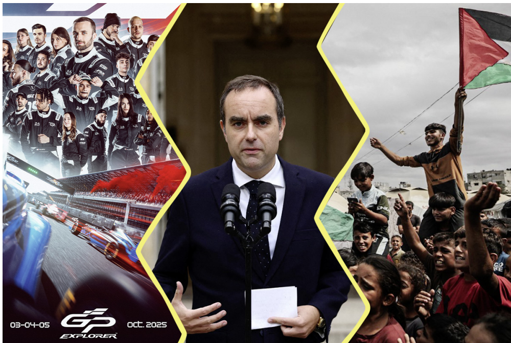
(© GP Explorer. Sébastien Lecornu : © Stephane Mahe / POOL / AFP . Scène de joie à Gaza le 9 octobre, à l'annonce de l'accord : © Moiz Salhi / Anadolu / AFP.)

Ça s'est passé entre le 3 et le 9 octobre : des stars d'Internet ont conduit des voitures de formule 4 sur le GP Explorer, la France a connu son gouvernement le plus court (quatorze heures !) et un cessez-le-feu a été annoncé à Gaza.