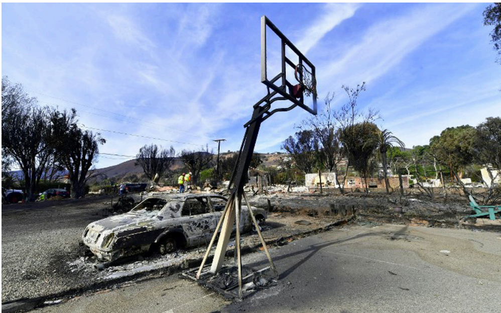
La ville de Malibu, connue pour ses plages de surf, a elle aussi été touchée par les incendies

Depuis plus de 15 jours, plusieurs incendies ont meurtri la Californie, aux États-Unis. Plus de 80 personnes sont mortes et plus de 500 manquent à l'appel : du jamais vu dans cet État, pourtant habitué aux feux de forêts. 1jour1actu t'explique ce qu'il s'est passé à travers une carte et des images satellites.