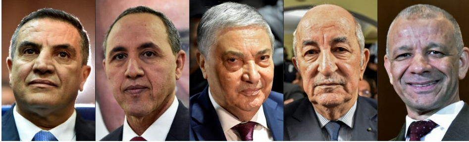
Les cinq candidats à l'élection présidentielle algérienne.