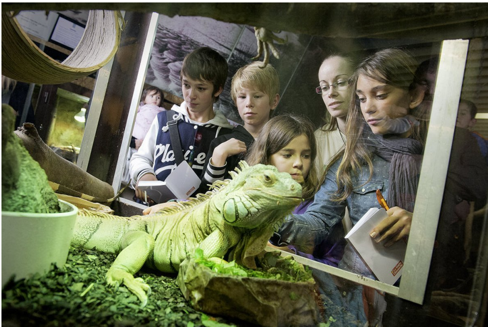
L'iguane d'Amazonie fait partie de la centaine de reptiles présentés à l'Aquarium-vivarium d'Aquatis, à Lausanne, en Suisse.

Poisson-alligator, piranha, crapaud sonneur, silure ou vipère du Gabon... 1jour1actu est parti à la rencontre de toutes ces espèces qui ont pour point commun de vivre dans les eaux douces du globe. On les découvre à Aquatis, un aquarium qui vient d'ouvrir ses portes à Lausanne, en Suisse.