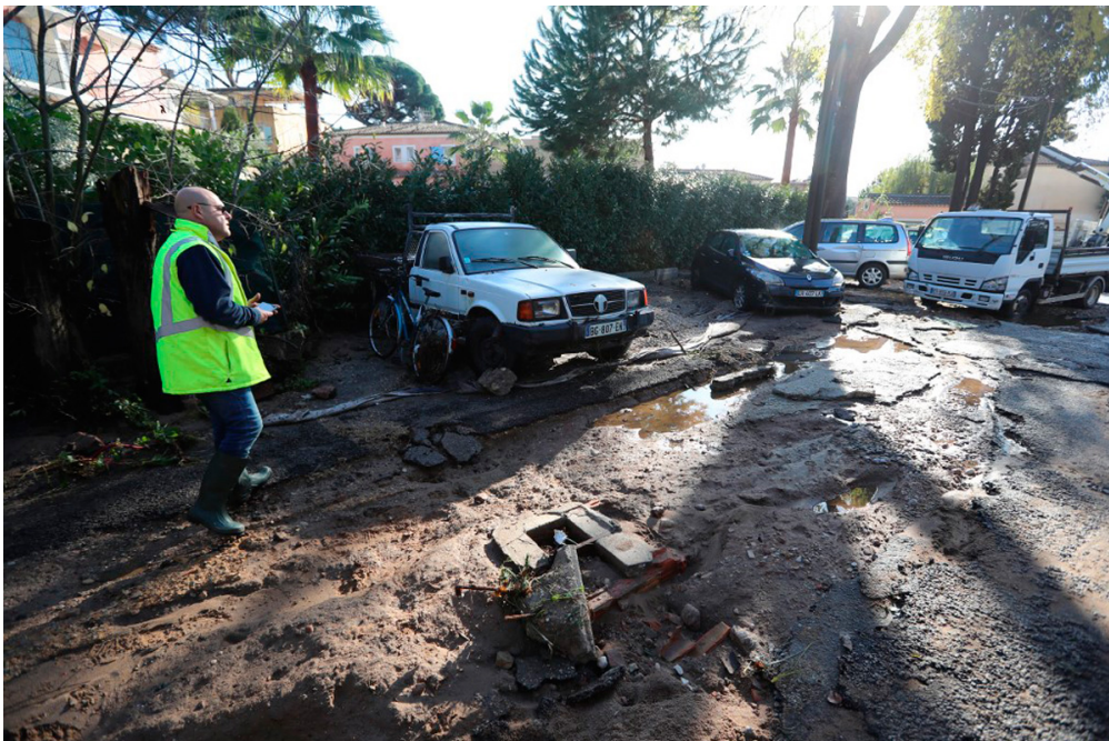
Voici une rue de la ville de Cannes, après l'inondation du 1er décembre.

En une semaine, le sud-est de la France a vécu deux épisodes de pluies intenses. En tout, douze personnes sont mortes dans ces intempéries, dont six dans la journée du 1er décembre. De nombreux bâtiments sont abîmés ou détruits. Mais comment la pluie peut-elle faire tant de dégâts?? Découvrez l'explication en images.