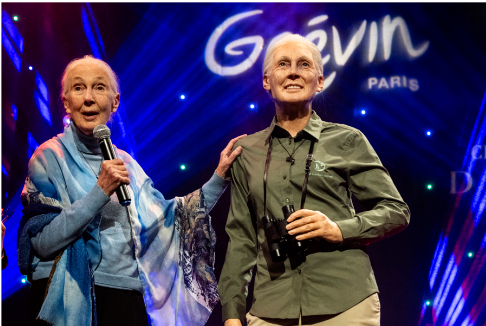
Jane Goodall, en bleu, découvre sa statue, habillée telle que l'était la scientifique quand elle observait les chimpanzés dans la forêt africaine.

Le 1er décembre, le musée Grévin, à Paris, a dévoilé une statue en cire de Jane Goodall, la grande spécialiste mondiale des chimpanzés. Ce musée rend ainsi hommage à cette célèbre scientifique de 89 ans, qui parcourt aujourd'hui le monde pour délivrer un message de respect envers l'environnement.