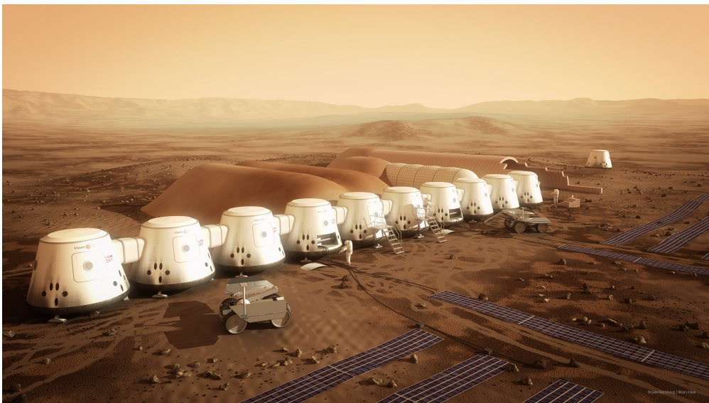
Ces capsules ont été imaginées pour accueillir les premiers humains vivant sur Mars.

Lors de la Semaine de la presse dans l'école, la classe de CM1-CM2 de l'école des Oustalous, à Toulouse, a visité la rédaction d'1jour1actu. Les élèves ont assisté à la conférence de rédaction au cours de laquelle les journalistes décident des sujets de la semaine. Un groupe d'enfants a choisi d'écrire un article sur le projet Mars One et de l'illustrer. C'est l'article que nous te proposons aujourd'hui sur le site d'1jour1actu.com