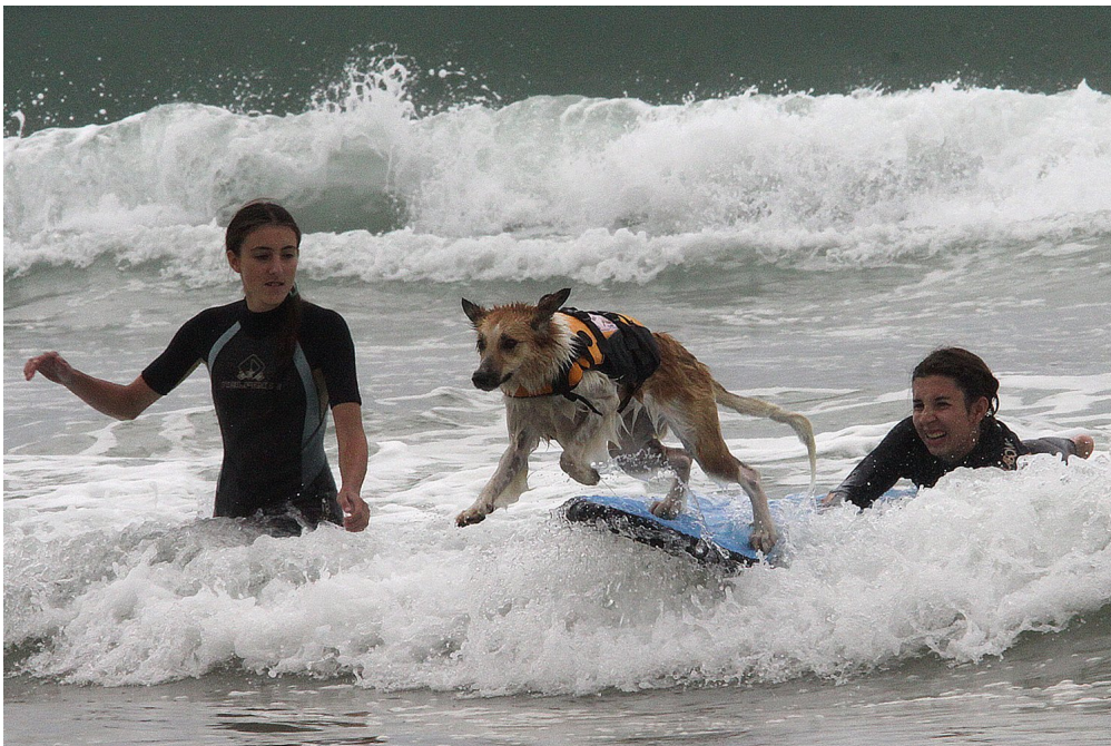
Un chien surfe sur une plage de Vieux-Boucau-les-Bains, en septembre 2014.