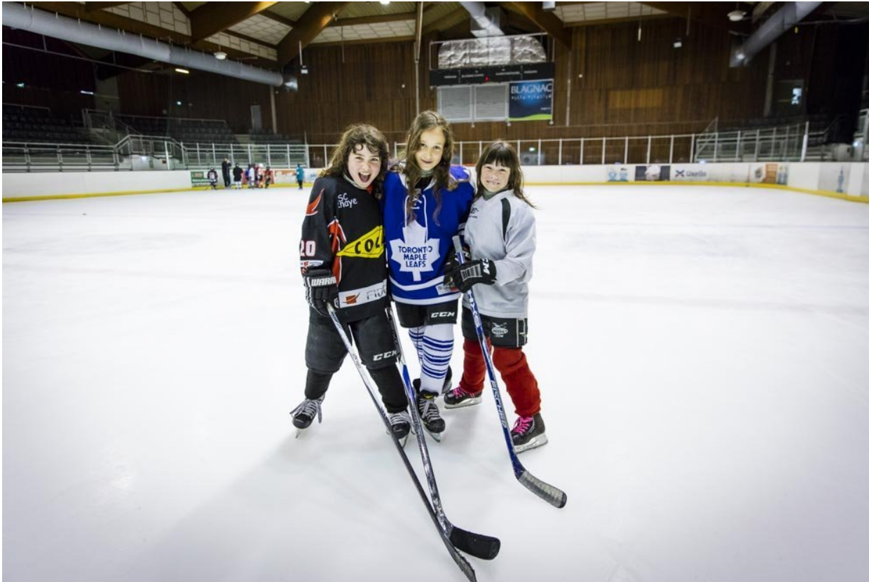
Vive le girl