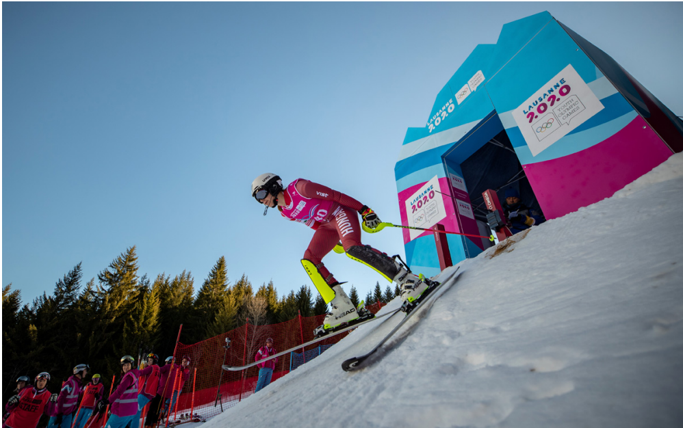
Ski alpin, biathlon, patinage artistique... tous les champions de demain sont à Lausanne !

Tous les quatre ans, les Jeux olympiques de la jeunesse donnent rendez-vous aux meilleurs jeunes sportifs du monde. Cette année, c'est à Lausanne, en Suisse, qu'est organisé ce rendez-vous. 1jour1actu y a rencontré les futurs champions de la glisse sur neige ou sur glace.