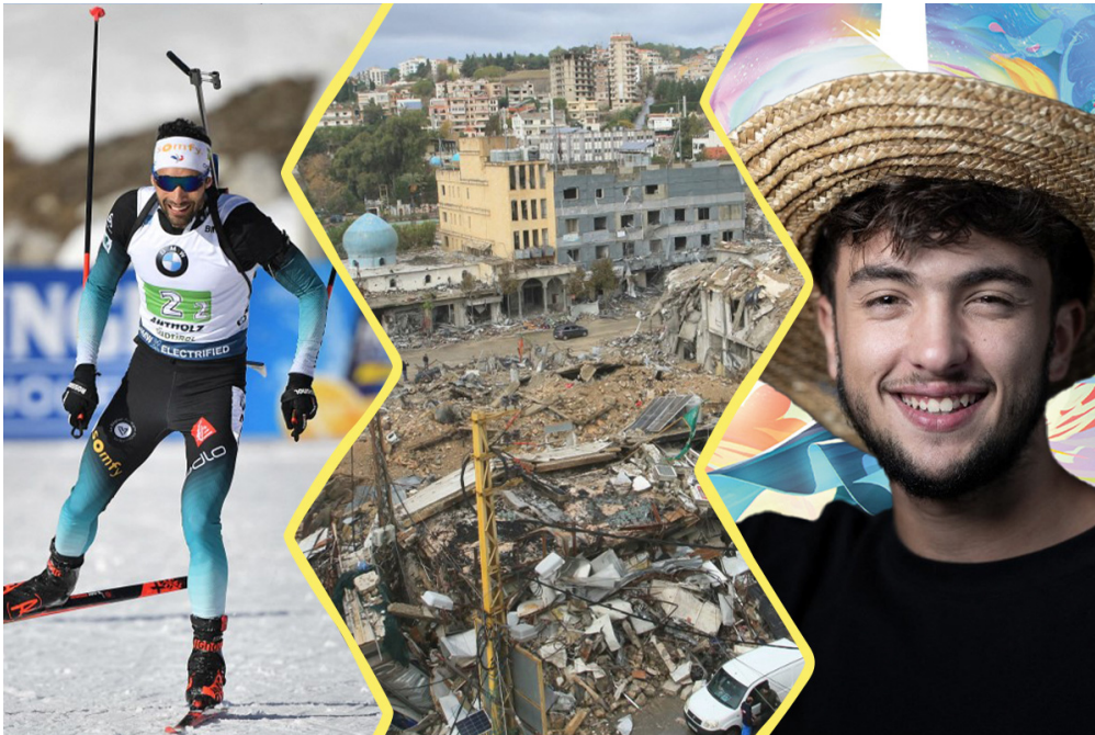
Martin Fourcade avant sa retraite en 2020. La ville de Nabatieh dans le sud du Liban. Inoxtag.

Ça s'est passé entre le 22 et le 29 novembre. Le biathlète Martin Fourcade a récupéré une médaille d'or 14 ans après sa course, un arrêt des combats a été décidé au Liban, et le premier manga du youtubeur Inoxtag a fait un record de ventes.