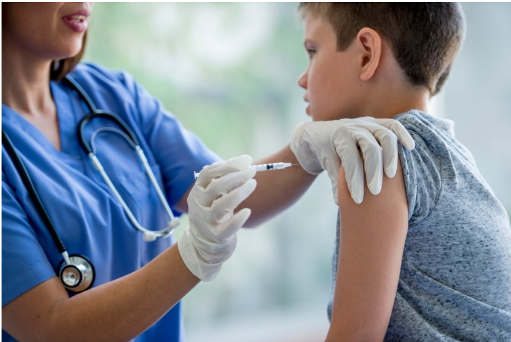
Google a inventé un moyen de faire des prises de sang sans aiguille.

Tu as peur des aiguilles et des prises de sang ? Google a inventé un nouveau moyen de prélever du sang sans utiliser d'aiguille. 1jour1actu te présente le projet de cette entreprise américaine experte dans les nouvelles technologies.