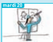
Mardi 20 Comment fait-on une BD ?