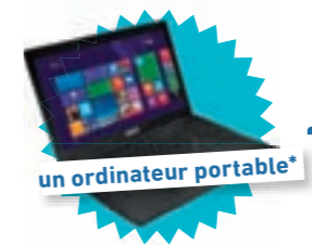
un ordinateur portable*