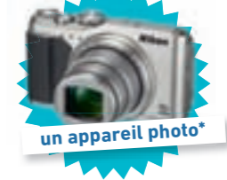
un appareil photo*

un abonnement à 1jour1actu et à l'e-mag 1jour1actu