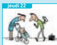
Jeudi 22 Le congé paternité