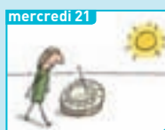
Mercredi 21 À quoi ça sert de savoir l'heure ?