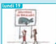
Lundi 19 Les baleines menacées ?

Les vidéos de la semaine sur www.1jour1actu.com