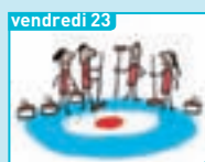
Vendredi 23 C'est quoi, le curling ?