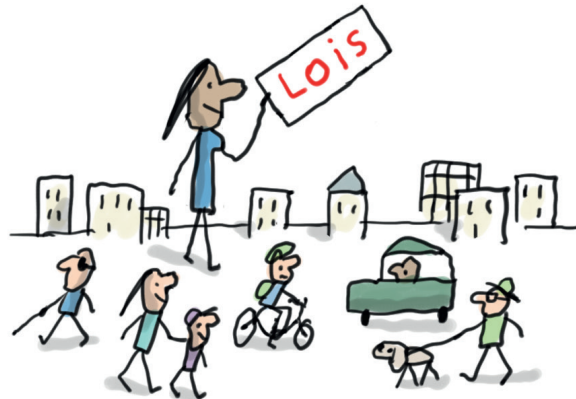
Illustration : Jacques Azam.

À l'âge où les enfants commencent à être capables de faire des choix, de réfléchir à la portée de leurs actes, il est nécessaire de les amener à comprendre et à appliquer les règles communes. Au cycle 3, l'enfant apprend que transgresser les lois peut conduire à des sanctions. Il comprend aussi que la loi peut le protéger.