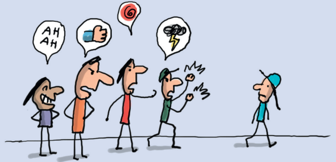
Illustration : Jacques Azam.