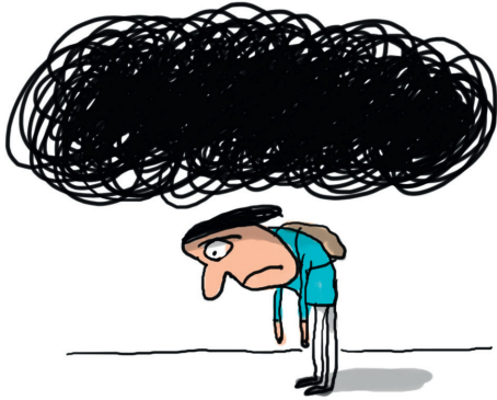
Illustration : Jacques Azam.

Se moquer, c'est pas grave ? ça peut être