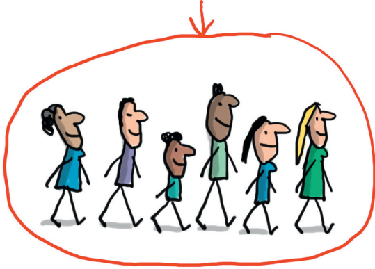
Illustration : Jacques Azam.

Retrouve tous les épisodes de Même pas vrai! sur ljourlactu.com