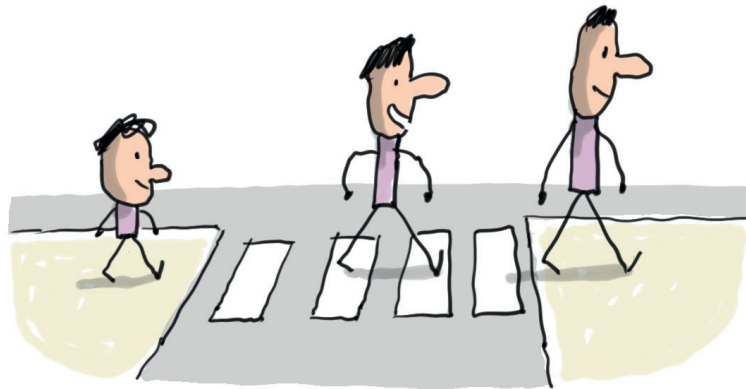
Illustration : Jacques Azam.