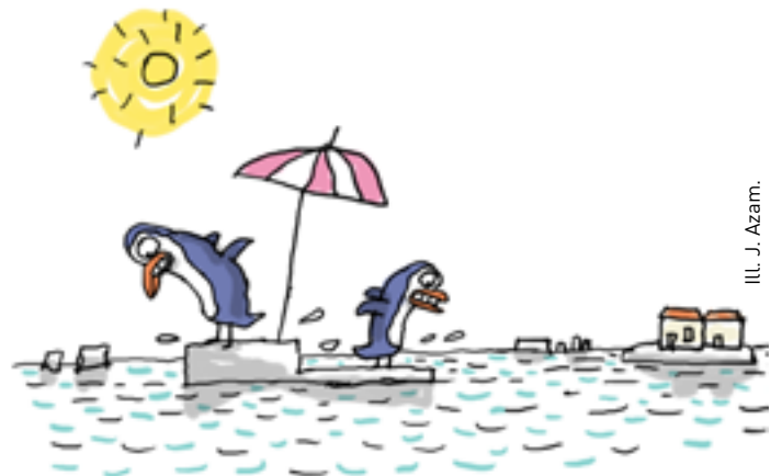
Ill. J. Azam.